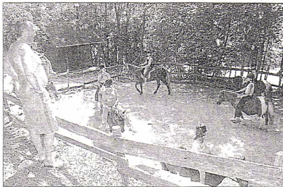
La structure dispose d'une quinzaine de poneys qui, le reste de l'année, sont mis à disposition des IME de la Drôme.

Centre de vacances adhérent de l'AFOCAL, Saint-Augustin affiche quasi complet sur tous les séjours multi activités ou à thèmes qu'il propose durant l'été, sur une semaine cumulable généralement. Cette année, toutefois, à la demande des parents et des jeunes, il en a organisé un de deux semaines non dissociables. Un mot vient à l'esprit pour définir leur teneur : diversité. Sur le thème du séjour « pompier », « boxe française », « hip-hop », « maçonnerie », « magie », « cirque », « grand-chef », « modélisme », « arts créatifs », « Formule 1 », « Stylisme » et autres, le centre de vacances Saint-Augustin séduit les 6/13 ans. Avec ceux multisports, il attire les 14 ans et plus qui ont leurs aises dans le chalet « La Daroulède » où ils vivent en autonomie, encadrés par des animateurs. Aux adolescents est offerte également la possibilité de participer à un voyage découverte de 15 jours, la Grèce cette année, mais il