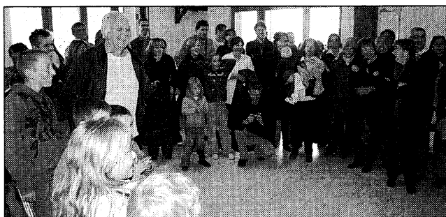
Le public a qui a tenu à être présent à cette inauguration.